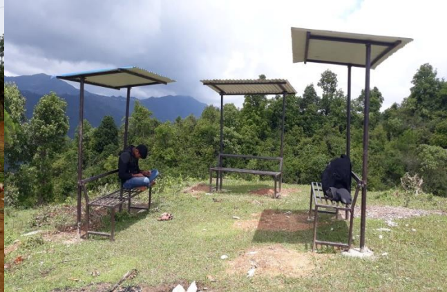
पर्यापर्यटन प्रवर्द्धन तथा शहरी हरित पार्क निर्माणका केही झलकहरु