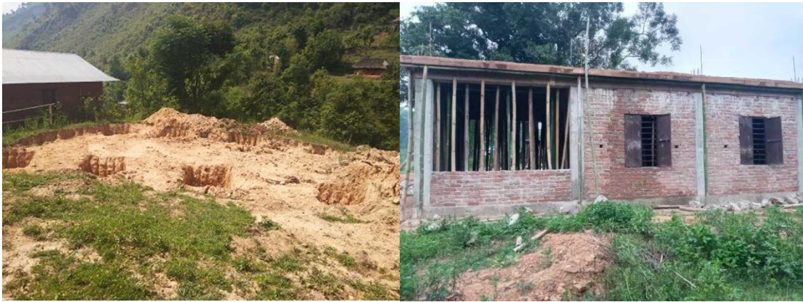
जडिबुटी भण्डारण केन्द्र निर्माण चरणका केही फलकहरु

विगतका आर्थिक वर्षहरुमा पाणिनी गाँउपालिका तथा यस कार्यालयको संयुक्त पहलमा तेजपात पकेट क्षेत्र घोषण मार्फत गरिएको वृक्षारोपण तथा प्राकृतिक तेजपातको प्रचुरता समेत रहेको पाणिनी गाँउपालिकाबाट उत्पादन हुने जडिबुटीलाई संकलन गरी भण्डारण गर्ने उद्देश्यका साथ जडिबुटी फोकल टिमको बैठकमार्फत निर्णय गरी पाणिनी ३ खिदिममा भण्डारण केन्द्र निर्माण गरिएको ।