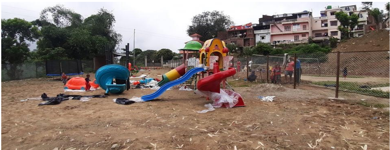
ज्योति बाल उद्यान निर्माणको भ्रमलक