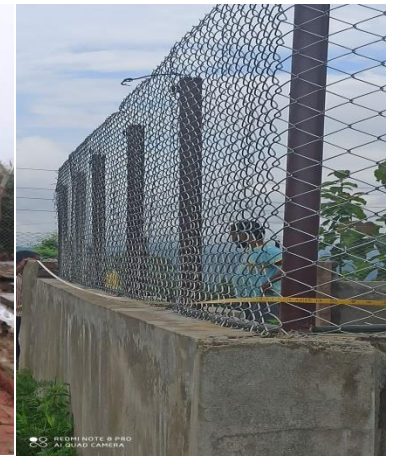
विन्धवासनि मन्दिर परिसरमा पर्यापर्यटन पूर्वाधार विस्तार अन्तर्गतका केही भलकहरु