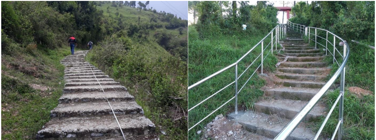
खाँचीकोट दरवारमा पर्यापर्यटन प्रवर्धनका लागि पहुचमार्गमा रेलिङ्ग निर्माण कार्यको झलक