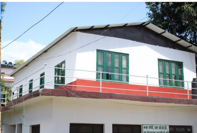
जैविक विविधता सुचना केन्द्र