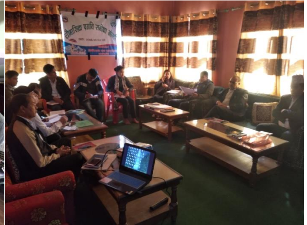
वार्षिक योजना तथा चौमासिक समिक्षा गोष्ठीका केही भलक