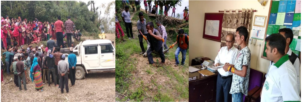
मानव वन्यजन्तु द्वन्द्व व्यवस्थापनका केही भलकहरु