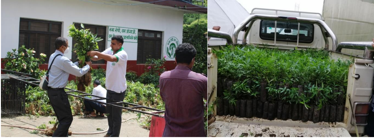
जडिबुटी तथा फलफुलका विरुवा खरिद र वितरणका केही भलकहरु

उपलब्धि : वृक्षारोपण वर्ष २०७६ अन्तर्गत फलफुलमा आत्मनिर्भर बनाउने गरि नेपाल सरकारले सुरु गरेको योजना अनुरूप पछिका लागि आम्दानीको श्रोत हुने फलफुलका विरुवा खरिद गरि स्थानि कृषि समुह, सहकारी तथा सामुदायिक वनमा वृक्षारोपण गरिएको ।