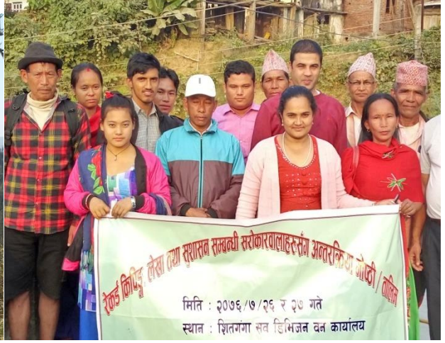
रेकर्ड किपिङ्ग, लेखा तथा शुसासन सम्बन्धि तालिम