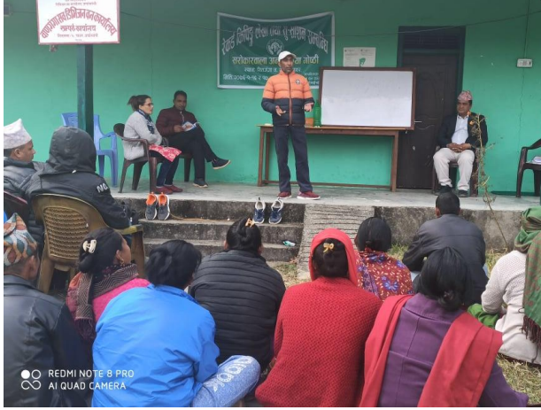
रेकड किपिङ्ग तालिम