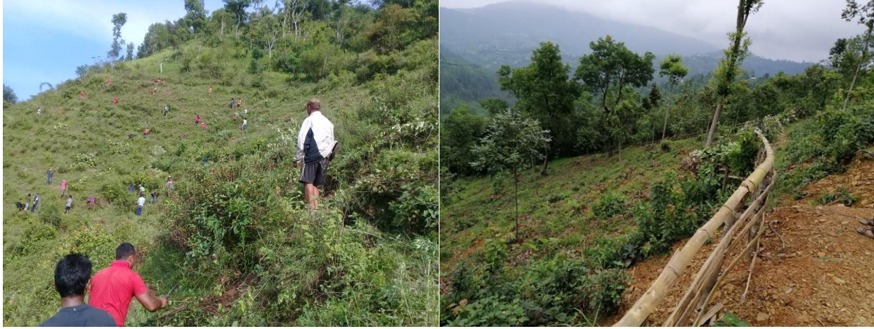
वृक्षारोपण क्षेत्रका केही भलकहरु

उपलब्धि : स्थानिय स्तरमा रोजगारी सिर्जना भएको तथा सा.व.का खाली स्थान तथा भाडी बुट्यान रहेको स्थानलाई सफाई गरी समुहको आम्दानी बढाउने प्रजातिको वृक्षारोपण गरिएको ।