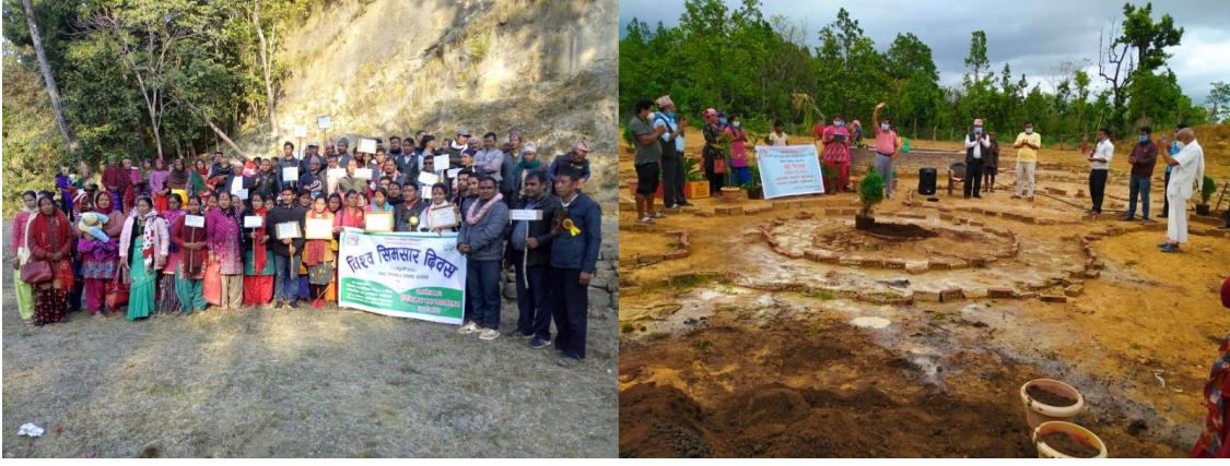
विभिन्न दिवश समारोहका केही झलकहरु