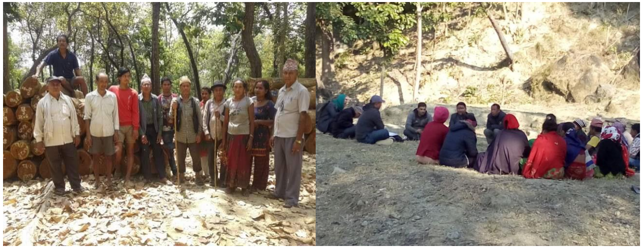
वन संरक्षणका लागि गरिएको संयुक्त गस्ती परिचालनका केही भलकहरु