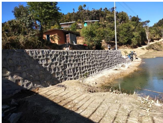
पँचेनापोखरीको सिमसार क्षेत्र