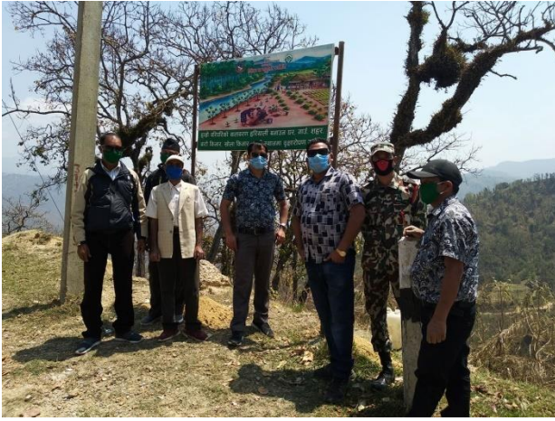
सुचनामुलक होडिङ्गबोट स्थापना गर्दै