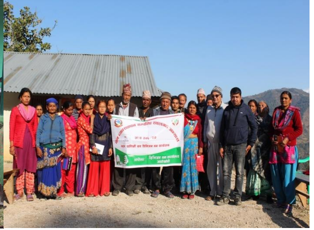
वन व्यवस्थापन सम्बन्धि स्थालगत अभ्यास