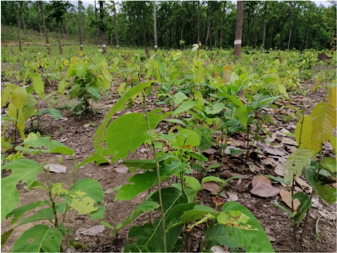
Fire incident location, Arghakhanchi (2000 to 2019)