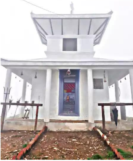
माईकोथान भगवती मन्दिर