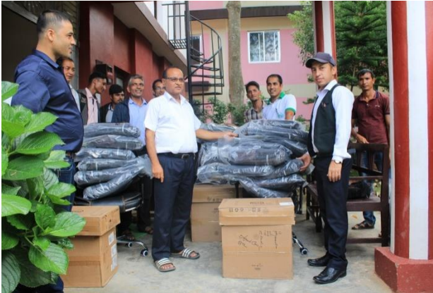
स.डि.व.का. का लागि समाग्री वितरण