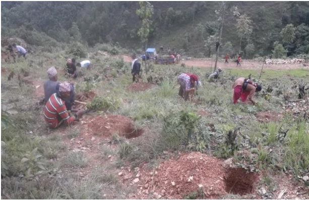
वृक्षारोपणका लागि तयार गरिएको खाडल