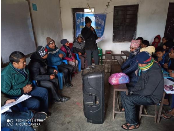
इको क्लब गठन