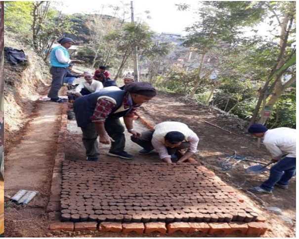
नर्सरी व्यवस्थापन सम्बन्धि कोचिङ