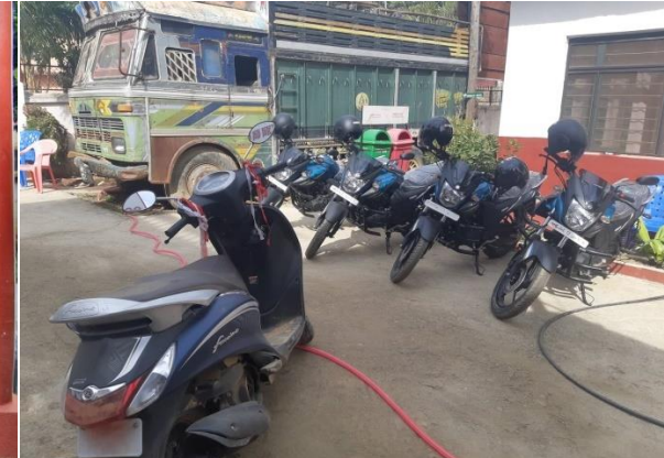
चालु आ.व.मा खरिद गरिएको मोटरसाईकलहरु