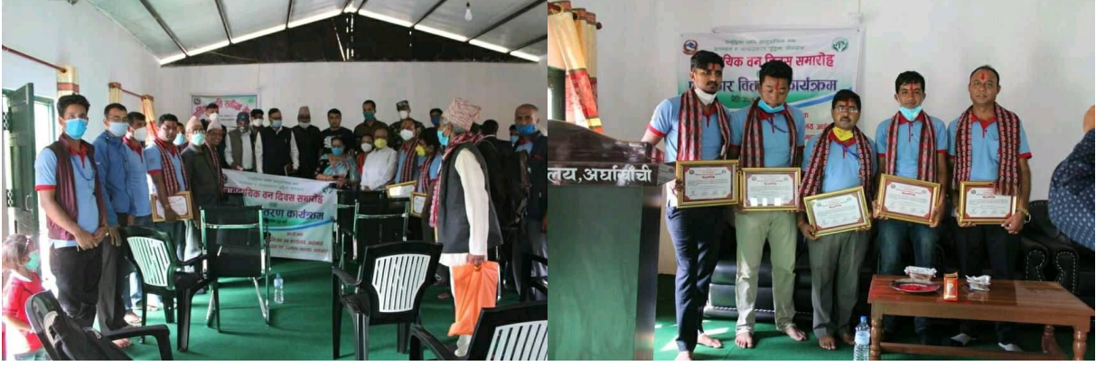
उत्कृष्ट सा.व. तथा कर्मचारीहरुलाई पुरस्कार वितरण कार्यक्रमका केही भलकहरु