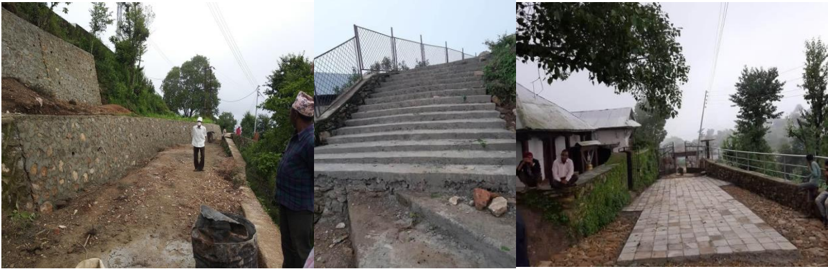
अर्घाभगवती मन्दिर पर्यटन प्रवर्धनका पूर्वाधार तयारीका केही झलकहरु