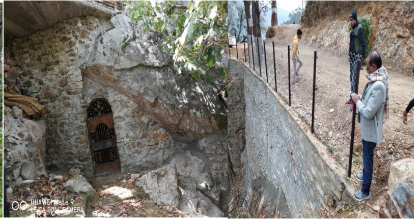
नरसिंह मन्दिरमा पर्यापर्यटन पूर्वाधार विस्तार अन्तर्गतका केही भलकहरु