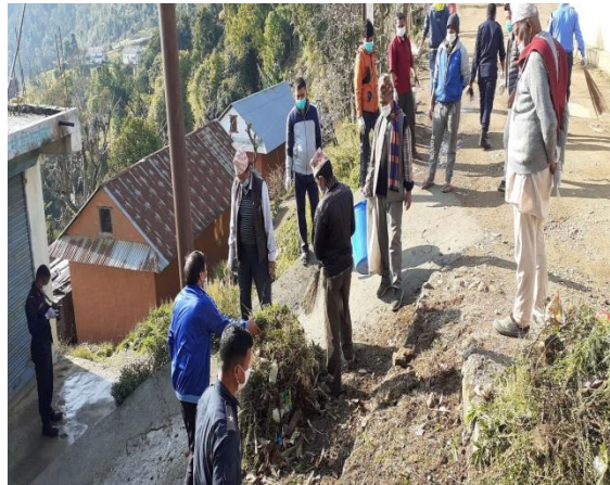
प्रदूषण नियन्त्रण सम्बन्धि कार्यक्रमहरुका केही भलकहरु