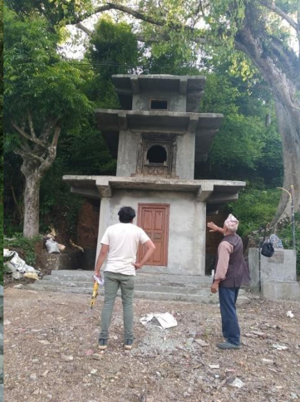
पदमार्ग शिव पंचायन मन्दिर निर्माण