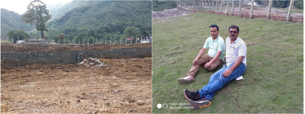
सहिद पार्कमा पर्खाल निर्माण तथा ढुबो रोपण कार्यको केही भलक