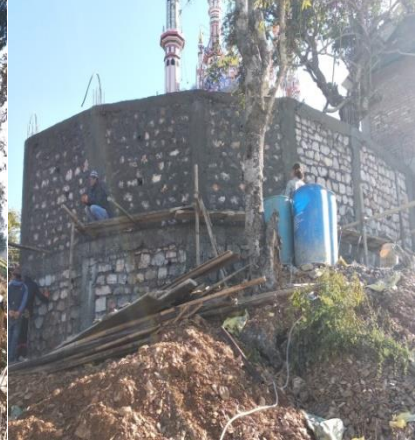
मस्जित व्यवस्थापन सम्बन्धि कार्यहरुका केही झलक