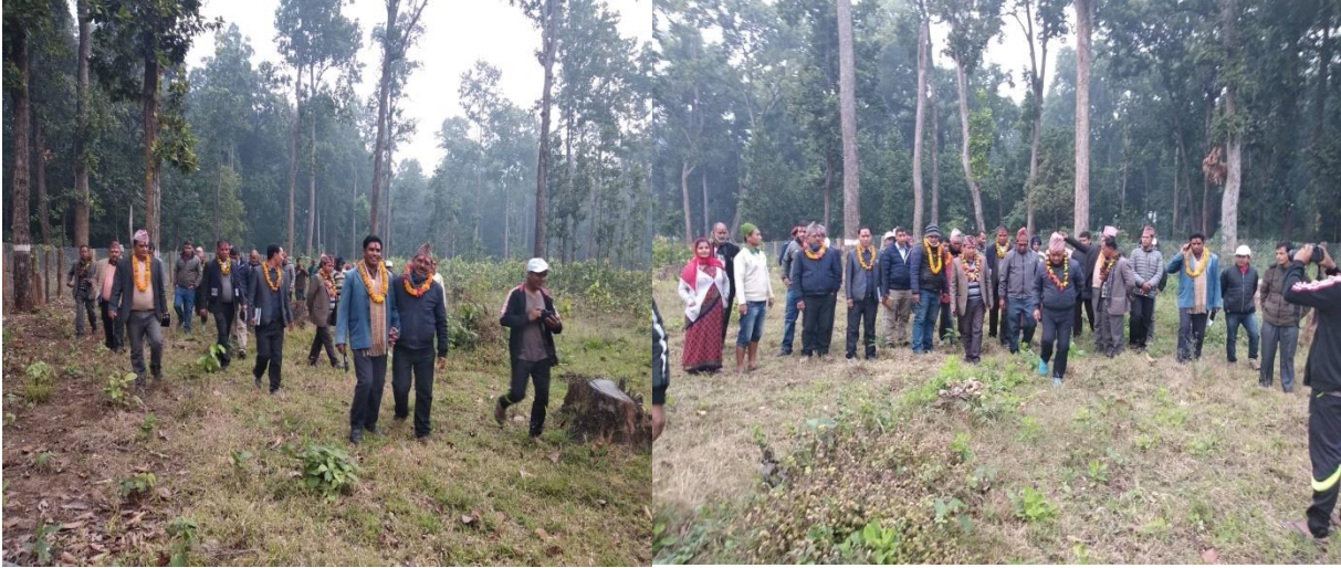
जिल्ला वन क्षेत्र समन्वय समिति सहित सरोकारवाला निकायको अनुगमन