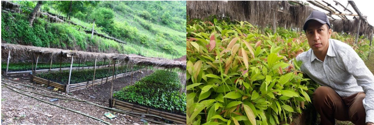
नर्सरीमा विरुवा उत्पादनको भ्रमलक

उपलब्धीहरु : एक जिल्ला एक जडिबुटी पकेट क्षेत्र अन्तर्गत मालारानी, छत्रदेव र पाणिनी गाँउपालिकालाई पकेट क्षेत्र घोषण गरि आगामि आर्थिक वर्षमा बहुवर्षिय विरुवा रोपणका लागि विरुवा तयार भएको तथा निजि कृषिकले आफ्नो निजि आवादीमा कृषि वन प्रवर्दनका लागि विभिन्न किसिमका डालेघाँसका विरुवा उत्पादन गरि वितरण गरिएको तथा सामुदायिक वन, मनोरञ्जन पार्क तथा खोला किनारमा वृक्षारोपणमा सहयोग पुगेको ।