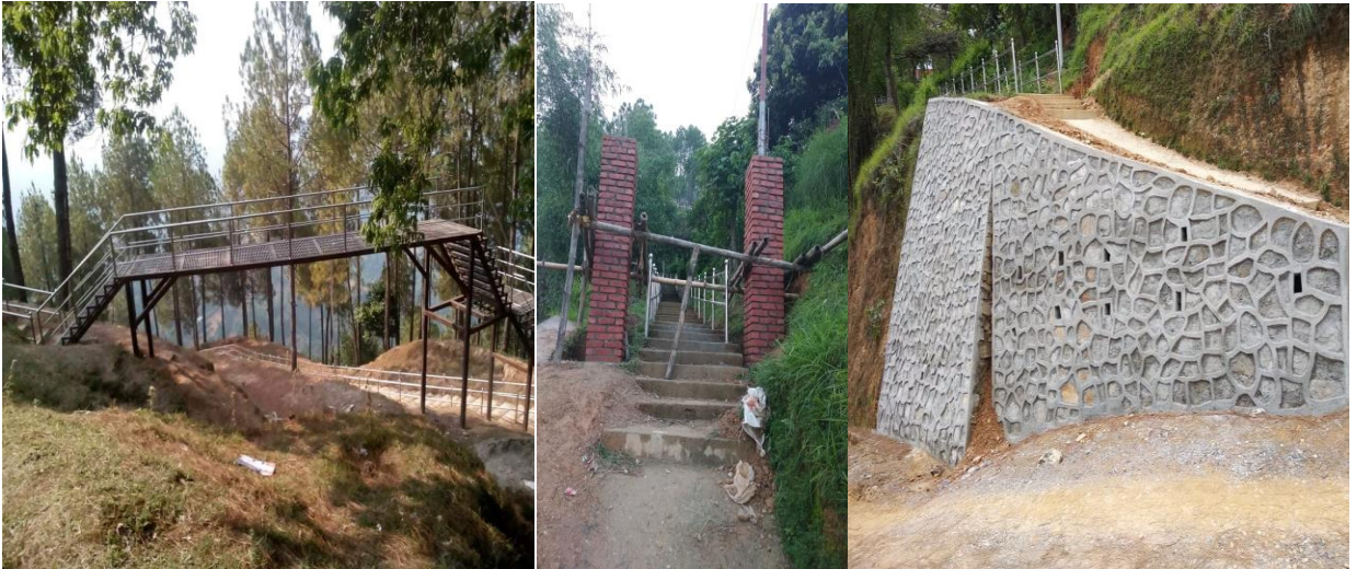
छत्रदेवालय मन्दिरमा पर्यटकीय पूर्वाधार निर्माण चरणका केही भलकहरु