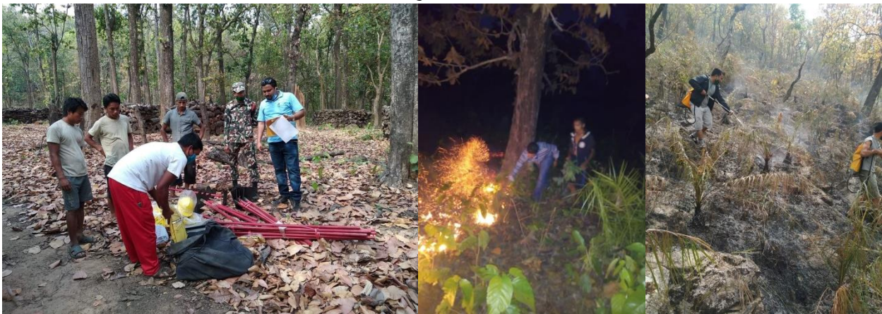
वन डढेलो नियन्त्रणका लागि भएका कार्यहरुका केही भलकहरु