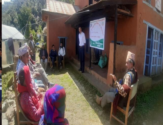
वन डढेलो संजाल निर्माण